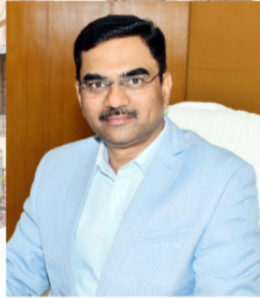
संभाग आयुक्त सुदामा खाड़े